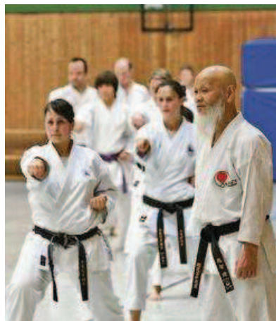
Anmutig: In Reih' und Glied übten die Schüler hochkomplexe Bewegungsabläufe.